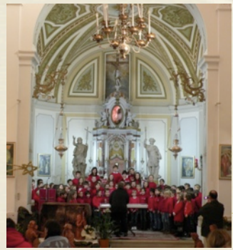
Il coro della Primaria

C'era una volta un enorme fabbrica di giochi: la fabbrica di Babbo Natale. - Oh mio dio! Quest'anno nessun bambino riceverà i regali di Natale! - urlava Babbo Natale allarmato - anche se lavorassimo fino all'estremo delle forze non ce la faremmo! La lista è troppo lunga non ce la faremo mai! C'è troppo poco tempo - si lamentava Babbo Natale rivolgendosi ai folletti. Curtis, il capo di tutti i folletti chiese: - Se suo figlio ci aiutasse riusciremmo a terminare la costruzione di tutti i giocattoli? - Certo - rispose Babbo Natale - solo che quel pigrone se ne sta alle Hawaii a ballare la Hula! - continuò. A quel punto intervenne Jack il vicecapo folletto, che chiese: - E se lo portassimo qui? - Splendida idea! Peccato che sia troppo tardi - disse Babbo Natale - Ma lui è l'unico che può salvare il Natale! - ribattè Curtis . - E va bene ! Farò un tentativo , manderò una renna con un messaggio appeso al collo e farò in modo che mio figlio lo legga. Così la renna andò alle Hawaii e rintracciò il figlio di Babbo Natale e gli fece leggere il messaggio. Il figlio esclamò: - Ma è terribile ! Renna portami subito al Polo Nord! Arrivato alla fabbrica cominciò subito a lavorare ed in un ora costruì più di un milione di giocattoli. La notte del 24 Dicembre, tutti i bambini ricevettero i regali tanto desiderati, grazie al figlio di Babbo Natale .