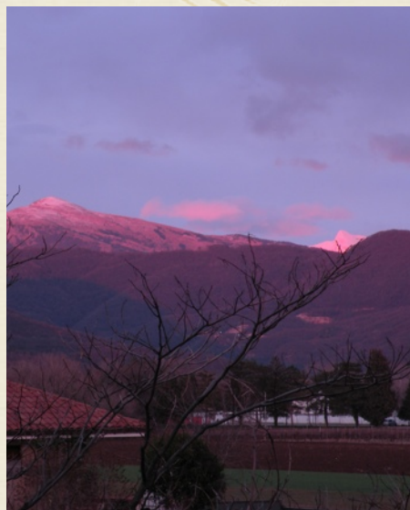
Foto scattata da una finestra della scuola, lunedì 19 dicembre

Il nome deriva da December, il decimo mese dell'antico calendario romano di Numa.