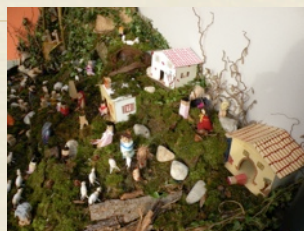
Immagini del presepe